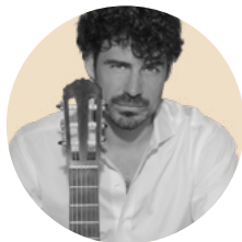
Pablo Sáinz-Villegas Guitarra/Gitarra