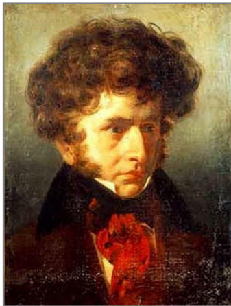
Hector Berlioz 1832an. Erretratua Émile Signolek egin dela uste da.

Erromantizismoko konpositore, zuzendari, musika kritikari eta idazle frantsesa. Hector Berlioz (1803-1869) orkestra modernoaren sortzailetzat jotzen da. Sentimendu eta emozioetan neurritz gainekoa, bere musika bere mundu-ikuskeraren eta bere bizipenen erakusgarria da.