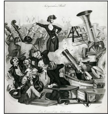
erliozen kontzertu bat, 1846 aldean.

1840an, Instrumentazio eta orkestrazio modernorako tratatua idatzi zuen, eta idazkiak eragin erabakigarria izan zuen ondoko konpositorerik handienetako batzuegan, hala nola Gustav Holst , Vincent d' Indy , Richard Strauss , Gustav Mahler eta Bostak taldean. 1846an, Faustoren kondenzazioa bukatu zuen. Estreinaldia, ordea, porrot hutsa izan zen eta, ondorioz, erreka jo eta atzerrira alde egin zuen, Parisko publikoaz atsekabeturik. Moskun, Berlinen edota Londresen arrakastaz zuzendu zuen lan hori bera. Berlioz, hala ere, nola edo hala saiatu zen entzule frantziarren aldeko iritzia lortzen, baita edozein amarru erabiliz ere. Horrela, artzain-abiesbatza bat sartu zuen bere Kristoren haurtzarora oratorioan, hura XVII. mendeko kapera-maisu batek ondua zela esanda. Jendeak lana zoragarri hartu zuen, eta Berlioz ederki trufatu zen horretaz, idazki batean.