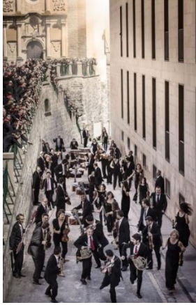
Orquesta Sinfónica de Navarra, por el Estudio fotográfico Pujol

Pablo Sarasatek 1879an sortua, Nafarroako Orkestra Sinfonikoa jardunean ari den talderik zaharrena da Espainiako orkestren artean. Gaur egun, Baluarte Fundazioan sarturik dago, nagusiki Nafarroako Gobernuak finantzatzen duena, eta Foru Komunitateko orkestra ofiziala da. Ehun eta berrogei urteko ibilbidean, Espainiako zein atzerriko auditorio, opera-denboraldi eta jaialdi nagusietan aritu da. Kontzertu batzuek garrantzi berezia izan dute; horien artean daude Parisko Théâtre des Champs Elysées eta Théâtre du Châtelet antzokietan hainbat aldiz emanikoak eta Universal Music zigiluak antolatutako biraren barnean Europako auditorio garrantzitsuetan egindakoak.