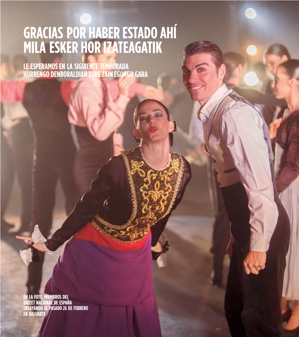
EN LA FOTO, MIEMBROS DEL BALLET NACIONAL DE ESPAÑA ENSAYANDO EL PASADO 26 DE FEBRERO EN BALUARTE

LE ESPERAMOS EN LA SIGUIENTE TEMPORADA HURRENGO DENBORALDIAN ZURE ZAIN EGONGO GARA